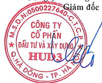
Vương Đăng Phương