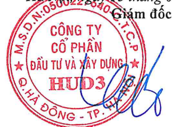
Vương Đăng Phương