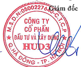
Vương Đăng Phương